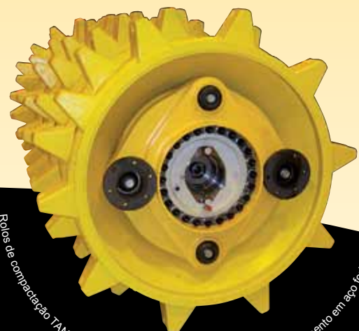
Roos de compactação TANA – 2 rolos a toda a largura com dentes de esmagamento em aço forjado

Os pesos e dimensões são atribuídos com tolerâncias standard. O fabricante do equipamento reserva-se o direito de fazer alterações se necessário. Alguns equipamentos deste catálogo podem ser opcionais e não de série.